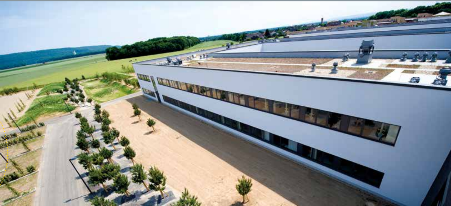
Campus Jülich der FH Aachen