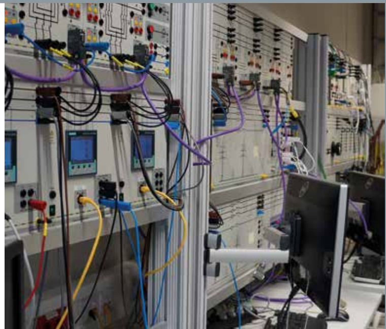
Die einzelnen Laborstationen können als in sich geschlossener Arbeitsplatz genutzt werden.

„Hier waren gerade die Mauern gezogen“, erinnert er sich, „da konnten wir noch Hinweise geben und das Labor auf die Systeme abstimmen. Die Ausstattung war auch für uns ein unglaublich spannendes Projekt, weil bis dahin kaum eine Einrichtung unser Smart Grid-System komplett installiert hatte. An der FH Jülich haben wir viel gelernt, so dass wir uns in der ersten Phase sehr eng ausgetauscht haben.“